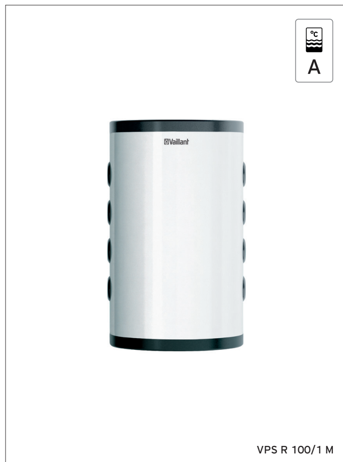
VPS R 100/1 M