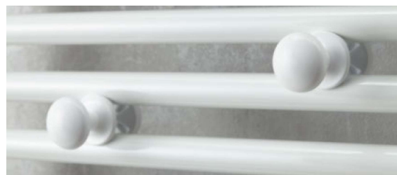
2 afneembare ophangknoppen